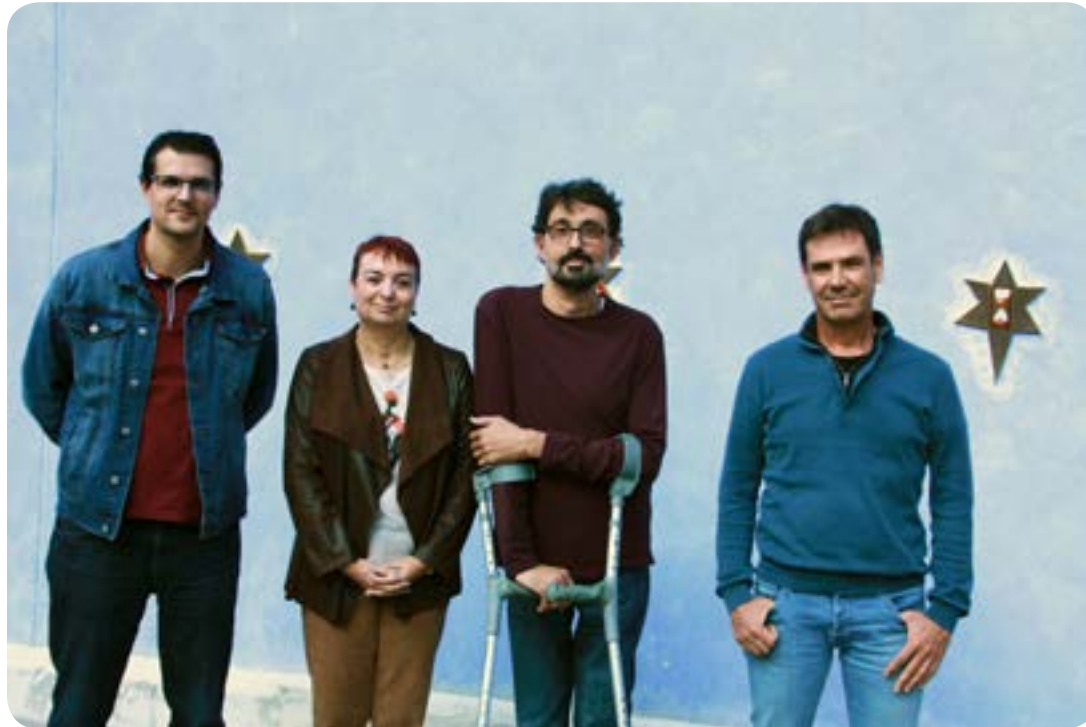
Candidatura CCOO en el Campus de Gandía