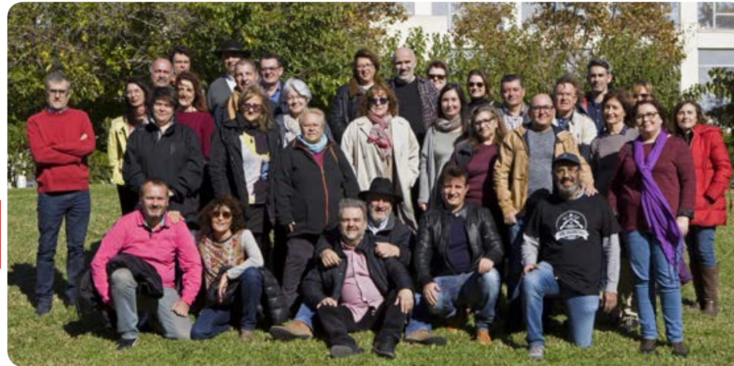
Candidatura CCOO en el Campus de Vera