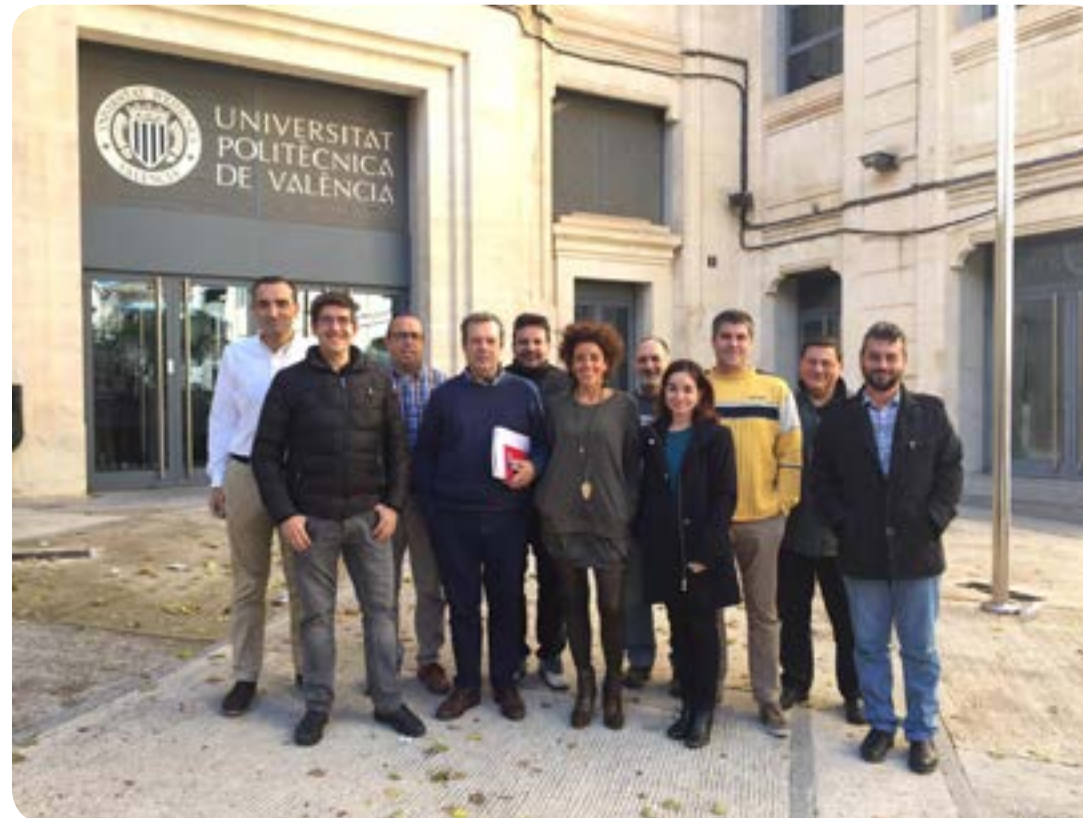
Candidatura CCOO en el Campus de Alcoi