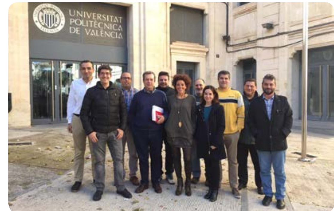
Candidatura CCOO en el Campus de Alcoy