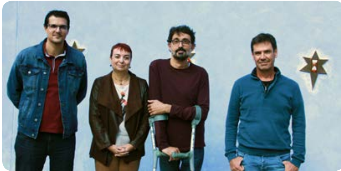
Candidatura CCOO en el Campus de Gandía